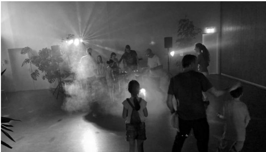
Let's fetz! Kinderdisco im KGH

Insgesamt haben wir mit der Langen Nacht der Kirchen 50 Personen erreicht, im ganzen Kanton Baselland waren es rund 4000. Schön waren die vielen bekannten Gesichter und die gute Stimmung. Etwas enttäuscht waren wir darüber, dass wir nur wenige kirchen-ferne Leute begrüßen konnten. Dass dies zukünftig besser und öfters gelingt, daran wollen wir arbeiten!