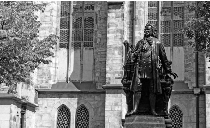
Geschichte neu erleben – eigene Wurzeln entdecken – Johann Sebastian Bach vor der Thomaskirche in Leipzig

Eine «Perle» zum Abschluss unserer Reise war in Leipzig der Besuch der Thomaskirche, in der Johann Sebastian Bach als Kantor und Organist im Einsatz war, und die bekannt gewordene Nikolaikirche, in der während den «Wöchentlichen Montagsdemonstrationen» sich Tausende Menschen zum Friedensgebet versammelten und damit eine friedliche Revolution und den Fall der Berliner Mauer am 9. November 1989 bewirkten.