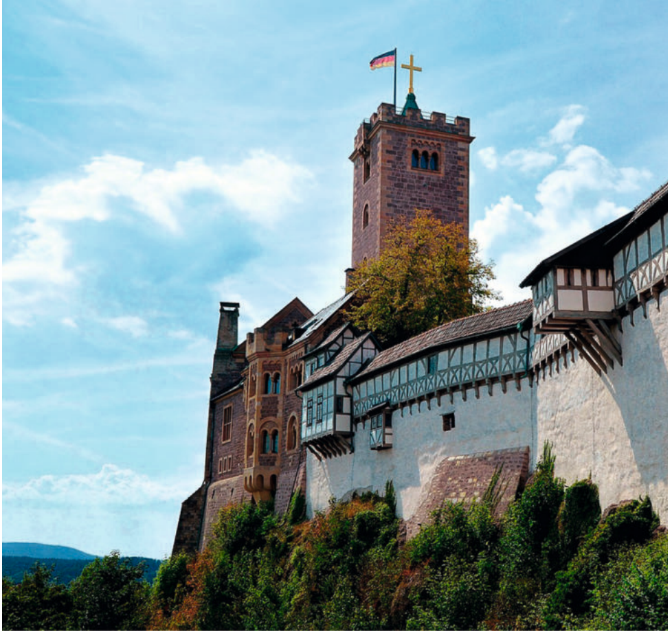
Wartburg bei Eisenach