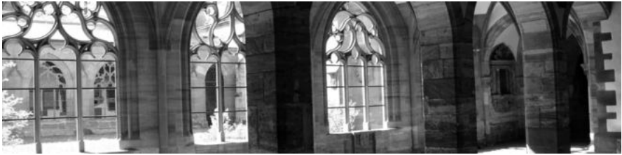
Kreuzgang des Basler Münsters

Come and join us in our singing and praying for justice, peace and the integrity of creation.