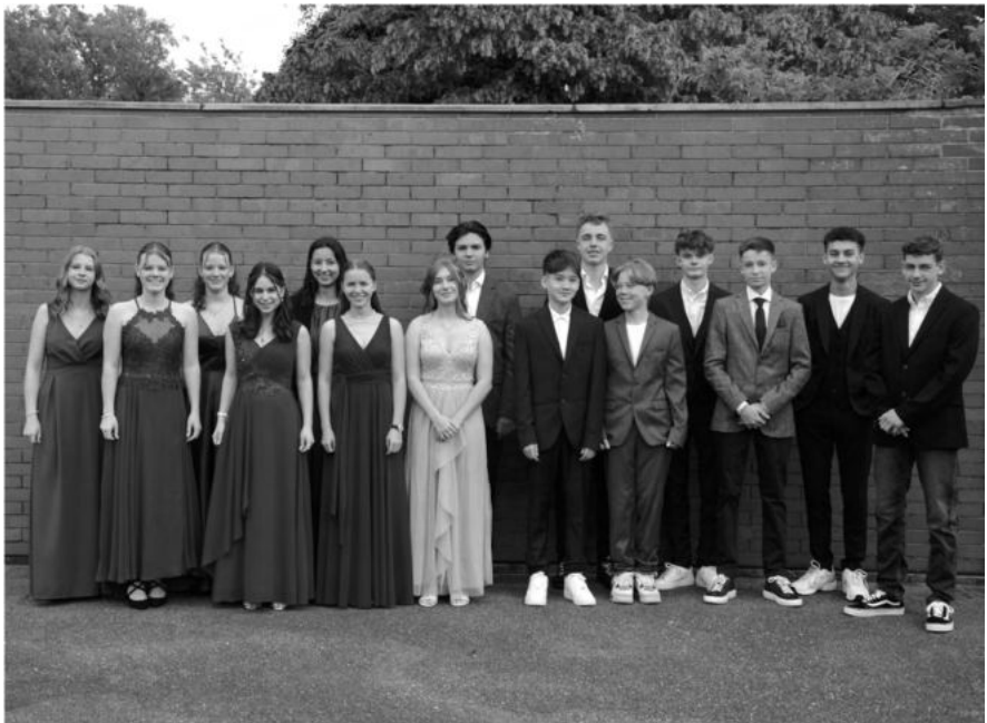
Ein grosses Fest – unsere Konfirmation vom 14. Mai 2023