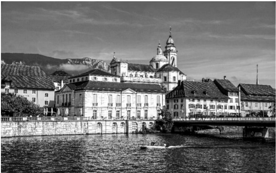
St. Ursen-Kathedrale in Solothurn

Herzlich laden ein, Pfr. Hansueli Meier und Team Erwachsenenbildung