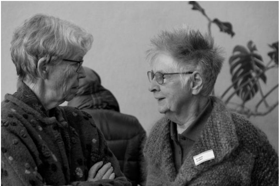
Business-Talk am Bazar!