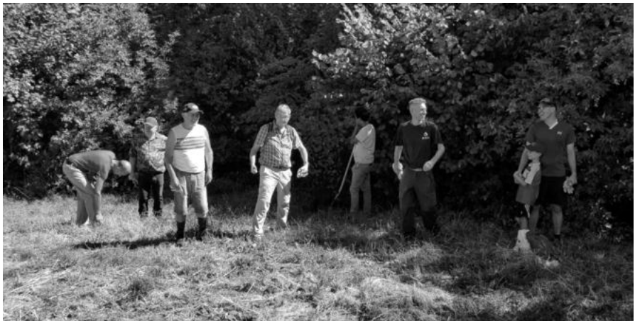
Schönheits-Pflege für den Münchener Wald!

Danke für Ihr Interesse und Ihre Mithilfe! Für den Bürgerrat, Verwalterin Alexandra Cosato