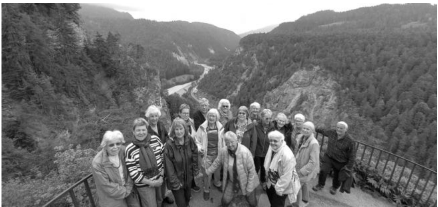
Der Kaffeetreff unterwegs im Bündnerland

Eine grössere Gruppe unternahm am Dienstag einen Ausflug nach Juf. Leider gab es diesmal keinen Kaffeehalt, weil noch alles geschlossen war. Auch die Vegetation war auf über 2000m noch nicht so weit wie im Tal.